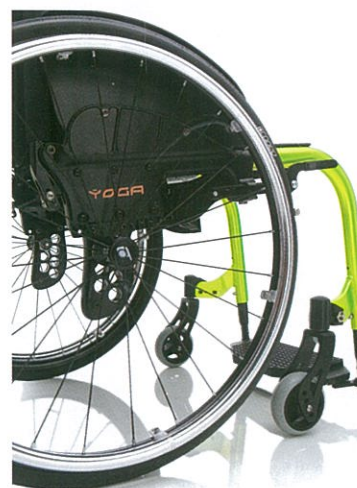
Molteplici regolazioni: › altezza posteriore › assetto › angolo schienale › altezza anteriore