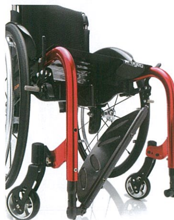
Possibilità di scelta tra vari tipi di pedana. Qui sopra unica alzabile in fibra di carbonio (optional)