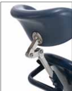
Poggiatesta regolabile in altezza e in angolazione per sostenere il capo