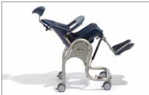
L'inclinazione di seduta è regolabile in modo continuo tramite una molla a gas da (-) 5° a 30°