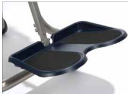
Poggiapiedi richiudibile verso l'alto e ad inclinazione regolabile in materiale ABS di alta qualità