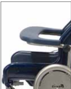
Braccioli inseribili per la stabilizzazione e l'allineamento del tronco