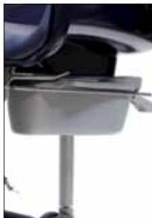
Pratico dispositivo per WC