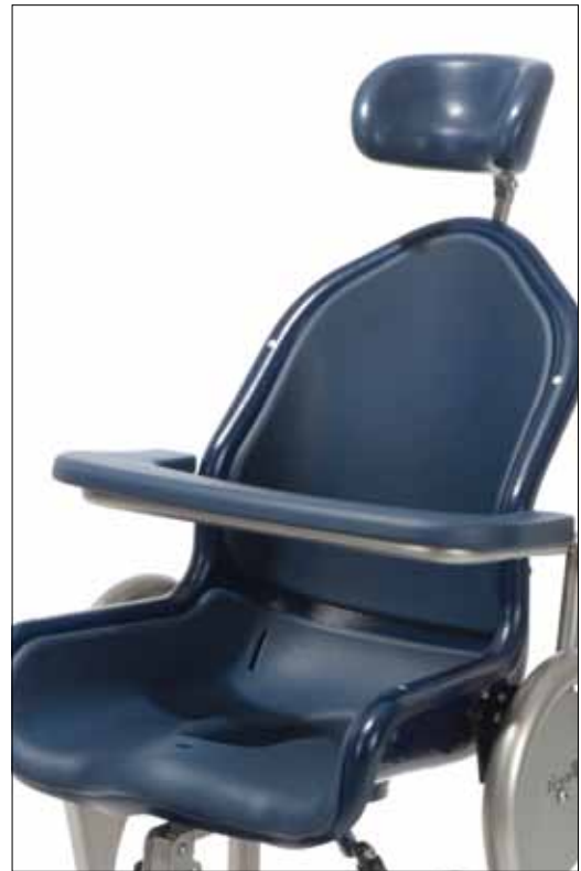
Seduta anatomica con ottimo sostegno per bacino per la stabilizzazione del tronco. Imbottitura in due parti inseribile per ulteriore confort di seduta