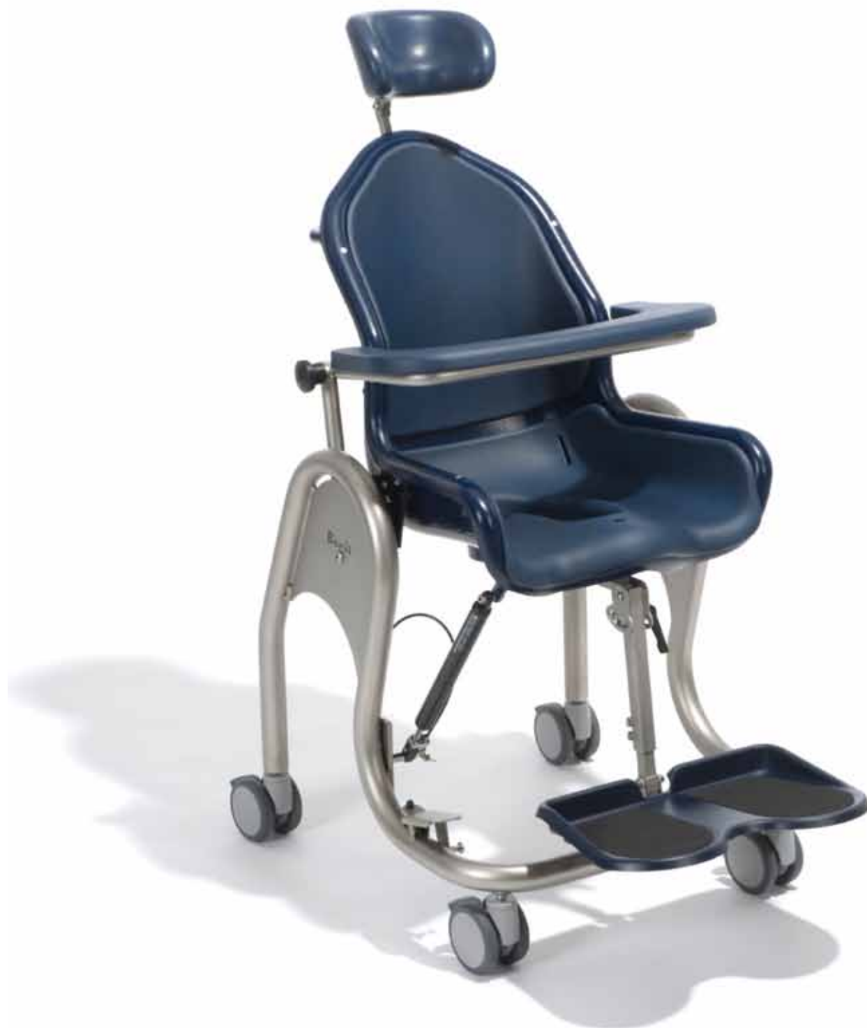
Fig. Modello base BORIS Mis. 2 Provisto di poggiatesta e poggiapiedi, braccioli e imbottitura