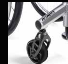
Forcelle anteriori, Carbotecture®