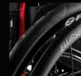
Corrimani, Ellipse 3R, neri