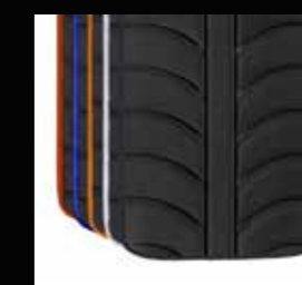
Telo schienale EXO PRO