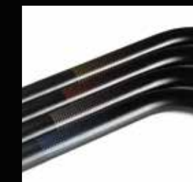
Telaio con finitura Floating dots