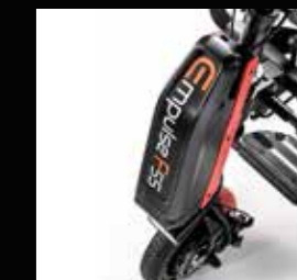
Con Empulse F55