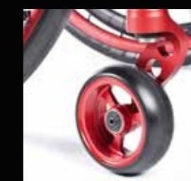
Forcelle anteriori, in alluminio, one-arm

Utilizza il visualizzatore online per creare la QUICKIE Nitrum dei tuoi sogni!