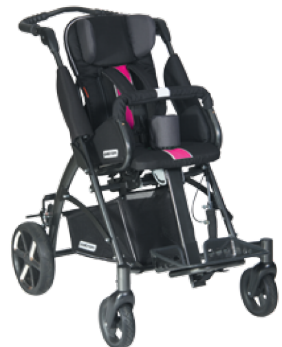
TOM 5 Clipper MAXI