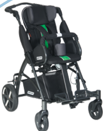
TOM 5 Clipper MINI