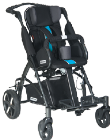
TOM 5 Clipper STD