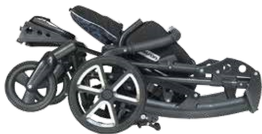
Tom 5 Clipper ripiegato

Un'eccellente varietà di colori del telaio e dei rivestimenti rende il tuo prodotto unico in stile e design.