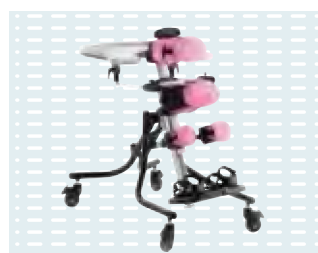
▶ Base basculante con ruote piroettanti in posizione prona