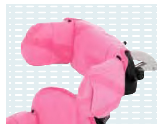
▶ Poggiatesta con supporti laterali