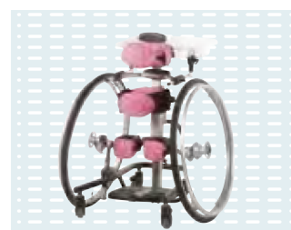
▶ Mobile base con ruote ad innesto rapido 27"