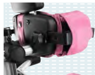
▶ Supporti tronco regolabili in altezza e larghezza (come i supporti per il bacino)