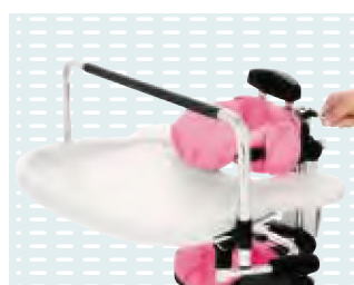
▶ Tavolino con struttura gioco